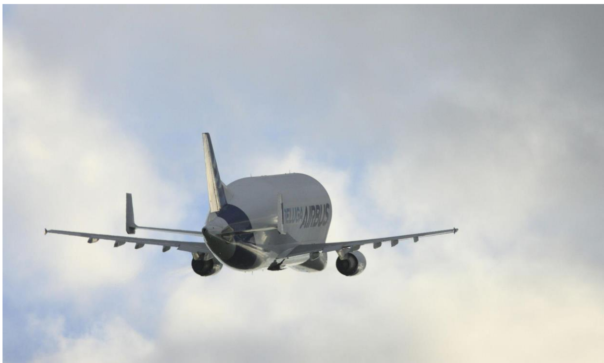
Abflug des Beluga-Flugzeugs vom Flughafen Toulouse

Toulouse, 11. März 2024 - Der von Airbus gebaute geostationäre Telekommunikationssatellit EUTELSAT 36D wurde an Bord eines Airbus BelugaST (A300-600ST) von Toulouse, Frankreich, nach Sanford, Florida, USA, transportiert. Im nächsten Schritt kommt der Satellit zum Kennedy Space Center in Florida, wo er Ende des Monats an Bord einer SpaceX Falcon 9 in die Umlaufbahn gebracht werden soll. Mit der Einführung der neuen BelugaXL, die auf der größeren A330-200-Plattform basiert, steht die A300-600 basierte BelugaST-Flotte nun vollständig für übergroße Frachttransportdienste weltweit zur Verfügung.