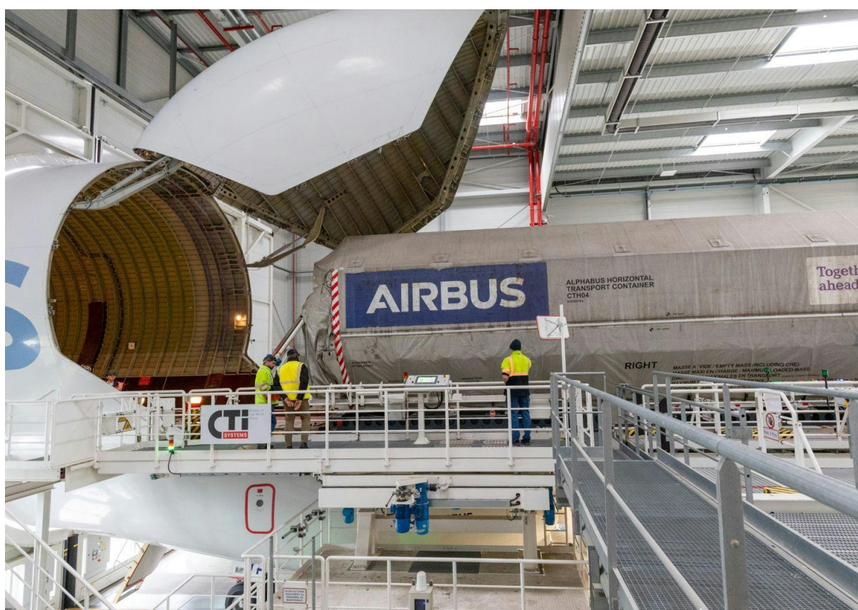
Verladung des Satellitencontainers in das Beluga-Flugzeug

Weitere Information auf der Airbus Beluga Transport Website